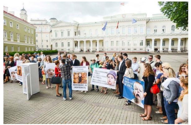
Piketas prie prezidentūros dėl Pagalbinio apvaisinimo įstatymo