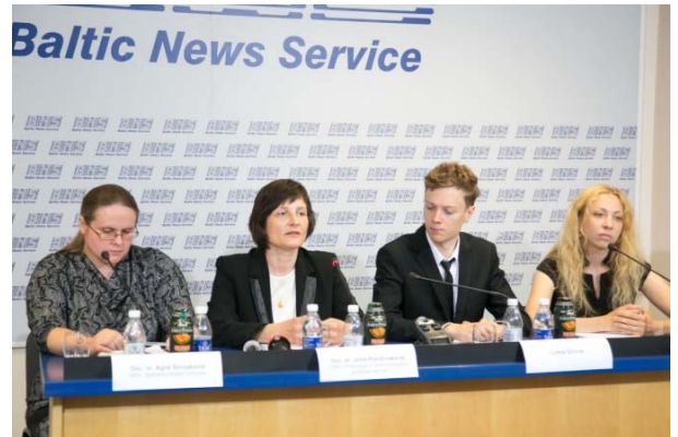
Spaudos konferencija dėl Pagalbinio apvaisinimo įstatymo