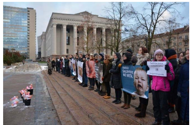
Piketas prie Seimo dėl Pagalbinio apvaisinimo įstatymo