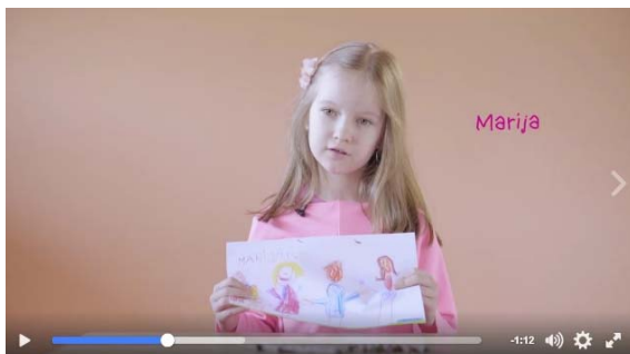
Video „Vaikai žino, kaip atsiranda šeima“ (104 tūkst. peržiūrų)