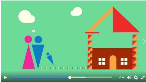
Video „Vyro ir moters santuoka yra ypatinga“ (45 tūkst. peržiūrų)