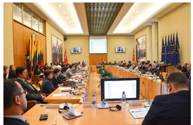
Konferencija „Konservatizmo ir krikščioniškosios demokratijos misija šiuolaikinėje Lietuvoje“