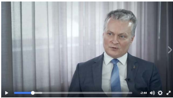
Video „G. Nausėda: Stipri valstybė be stiprios šeimos neįmanoma“ (127 tūkst. peržiūrų)